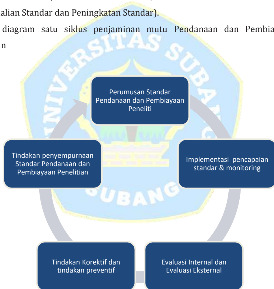
Gambar IV.1 :

Berikut diagram satu siklus penjaminan mutu Pendanaan dan Pembiayaan Penelitian